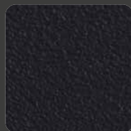
Matt-Schwarz / Matt-Black 00002